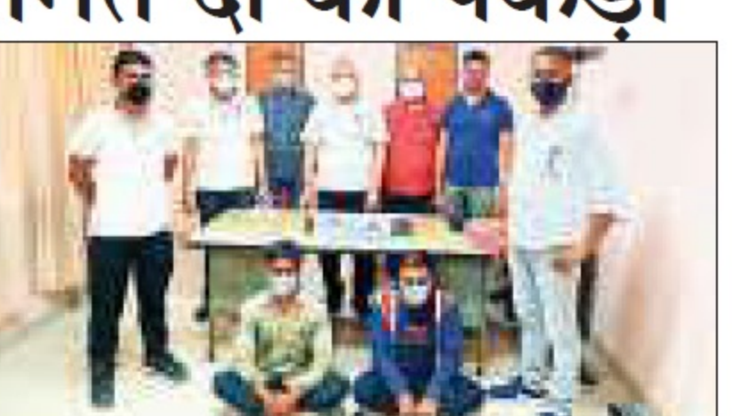
पुलिस गैंग के बाकी मेंबरों की तलाश में छापेमारी कर रही है।

है। इनसे दो रिवॉल्वर और चार कारतुस कारतुस बरामद हो चुके हैं।